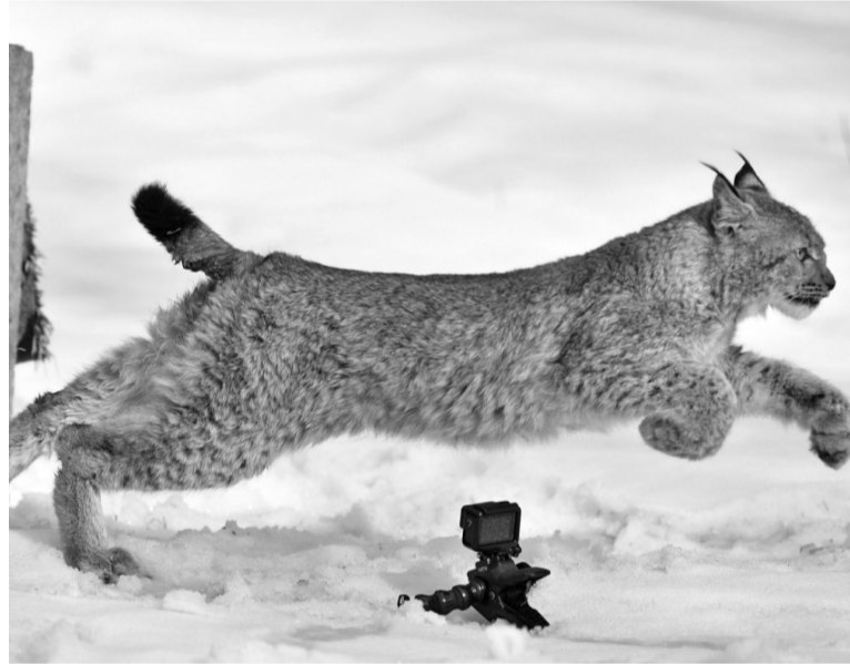
Рысь на воле