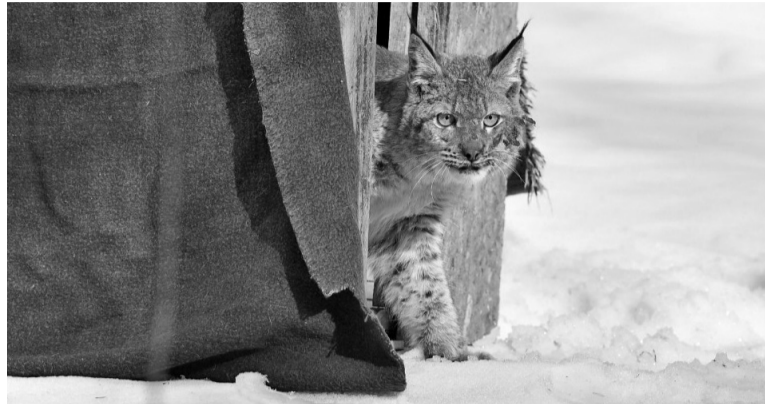
Васька готовится на свободу

В конце марта самец рыси пришел в город в поисках еды. А 22 апреля вернулся в лес: охотинспекторы вывезли его в Пряжинский район. Первое время за зверем будут присматривать и подкармливать – надо убедиться, что он нормально освоится в природе. Расставание с котом, получившим имя Васька, сняли корреспонденты «Республики».