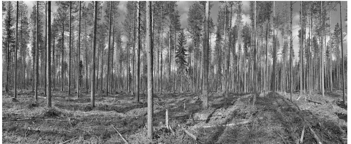
На делянке «Сеgezжа Групп»

28 апреля на делянках Segezha Group (входит в АФК «Система») прошел семинар-совещание о практическом применении новых нормативов интенсивной модели использования и воспроизводства лесов, которые были разработаны специально для Карелии и утверждены в Минтесте России в прошлом году. Нормативы разработал СФБНИИЛХ.