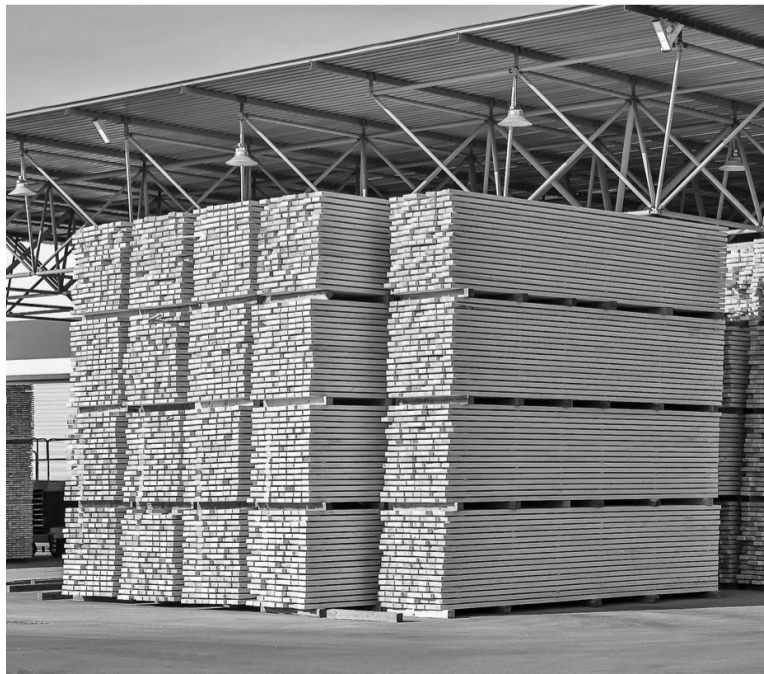
На «Русском Лесном Альянсе»