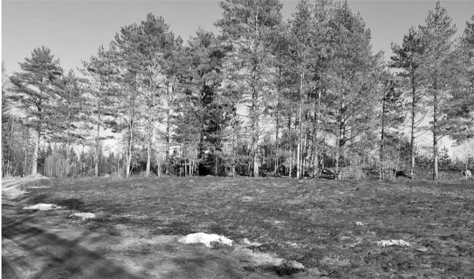
Пожар в Сортавальском лесничестве

19 апреля недалеко от поселка Хюмпеля произошел первый в 2021 году лесной пожар. Огонь перешел на земли лесного фонда в результате бесконтрольного выжигания сухой травы. Площадь пожара составила 1 га.