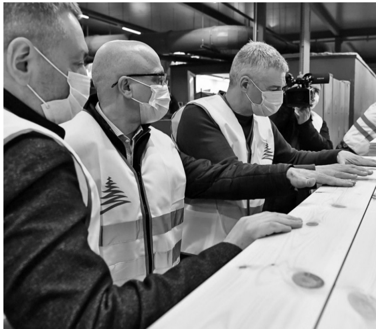
Сергей Савицкий, Элиссан Шандалович и Артур Парфенчиков

Сергей Михайлович Аноприенко, ранее занимавший должность заместителя Министра природных ресурсов и экологии Российской Федерации – руководителя Федерального агентства лесного хозяйства, распоряжением Правительства Российской Федерации от 12 апреля 2021 г. № 950-р освобожден от занимаемой должности и назначен на должность заместителя Министра природных ресурсов и экологии Российской Федерации.